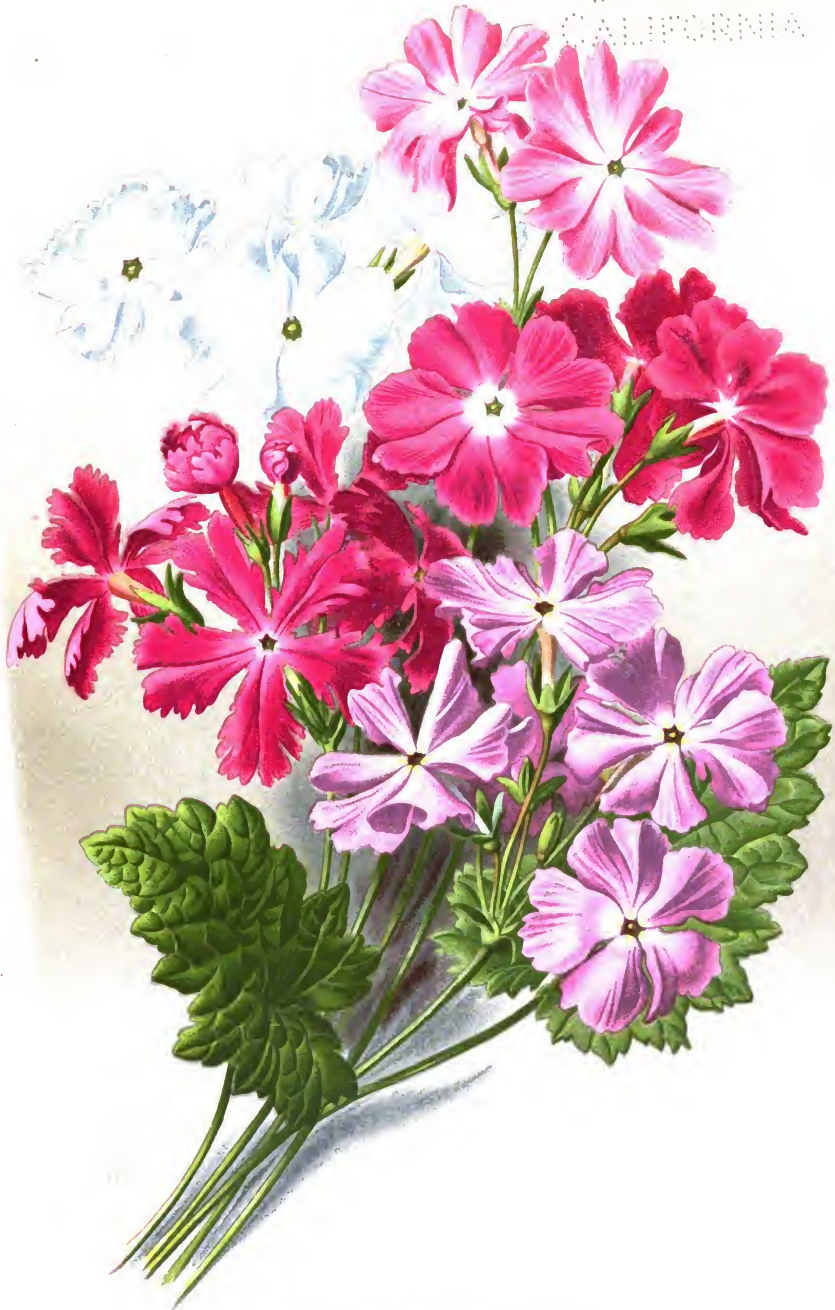
Primula cortusoides L.

Первоцвѣтъ [даурскій] въ разныхъ сортахъ.